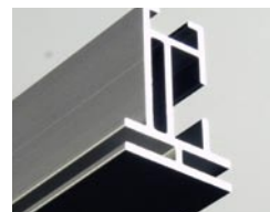
Matrix Frame [beidseitig / 32 mm]