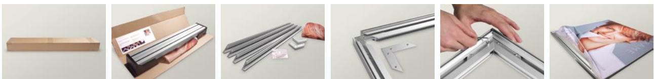
Matrix Ultra Light [einseitig / 15 mm]