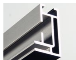
Matrix Frame [einseitig / 25 mm]