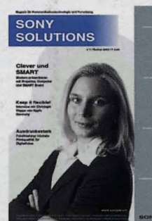
Kundenmagazin „SONY SOLUTIONS“

Das neue Heft will unter dem Untertitel „Magazin für Kommunikationstechnologie und Vernetzung“ produktübergreifend über Lösungen aus dem AV-Bereich informieren. Die erste Ausgabe des 20-seitigen Kundenmagazins wurde bereits auf der Systems