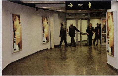
Leuchtkästen von Erler & Pless

Hamburgs neues Highlight, die Color Line Arena, gilt als Veranstaltungshalle der Superlative und zur Zeit als modernste Ihrer Art in Europa. Auch für Erler + Pless wird der