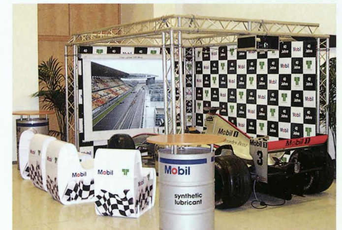
▲ Rasend einfach, rasend schnell: Ad Seats für den Stand der Mobil Oil. Terrifically simple, terrifically fast: Ad Seats for the Mobil Oil stand.