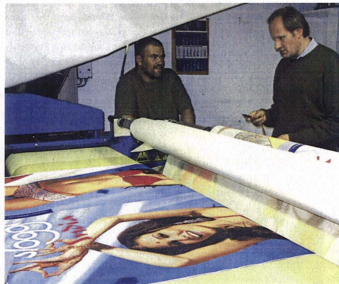
Abb_1: Qualitätskontrolle während der Produktion.