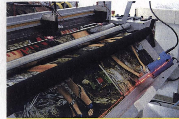
Abb_2: Ein Plakat im Großformat wird geplottet.

"Think Big": Die Druckspezialisten von Erler & Pless leben ihr Firmen-Motto. 1964 als Zwei-Mann-Fotolabor gegründet, hat sich das Unternehmen in den vergangenen Jahrzehnten zu einem weltweit gefragten Fullservice-Dienstleister entwickelt. Das Angebot reicht heute vom Foto übers Duplikatdia bis zur Druckvorlage sowie vom Grobdia auf Bahnhöfen und Flughäfen bis zum Großfoto auf Messen und Ausstellungen. Schon früh erkannten die Hamburger die Chancen der digitalen Fotografie und investierten 1992 als zweites Fotolabor in Deutschland rund eine Million DM in ein System zur elektronischen Bildverarbeitung. Mitte 1996 stiegen sie mit der Gründung der Hamburger Digitaldruck GmbH in den digitalen Offsetdruck ein. Dass Erler & Pless diesen aus dem Effeff beherrscht, zeigte erst jüngst die Vergabe des Branchenpreises "FESPA digitalprint awards 2008" an den Dienstleister. Zu den Kunden zählen vor allem Unternehmen der Mode- und Werbebranche. So lässt beispielsweise ein namhafter Dessous-Hersteller seine Produkte auf Plakaten, Leuchtreklamen, Stoffbahnen etc. von Erler & Pless in Szene setzen.