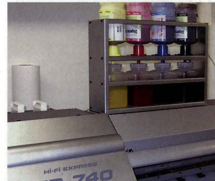
Für den Roland Hi-Fi Express FP-740 wurde das Tintenzuführsystem erweitert.

Erler+Pless fand einen Weg, mit wesentlich helleren Dias eine gute Farbwirkung zu erzielen. Deshalb liefert die Firma noch heute die Dias für die Leuchtkästen in den Zügen, und macht mit Eigenwerbung dort auch für sich Reklame.